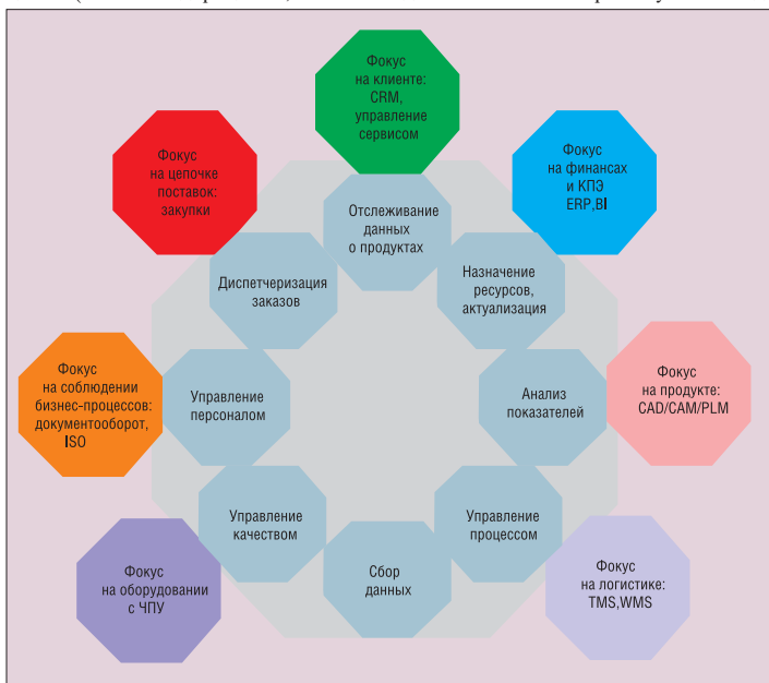
Рис. 5. Модель c-MES: границы функциональности

детальности предприятия, включающий детальное описание бизнес-процессов (а также подпроцессов, активно-